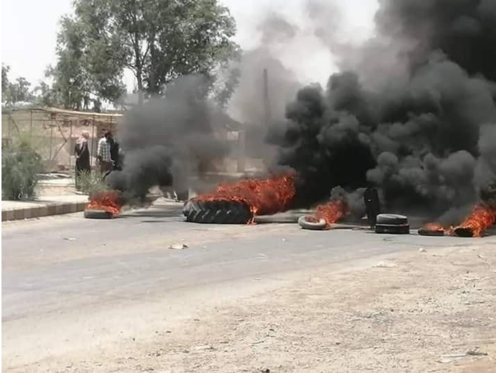
صورة من مظاهرات 8 حزيران/يونيو في بلدة الكسرة