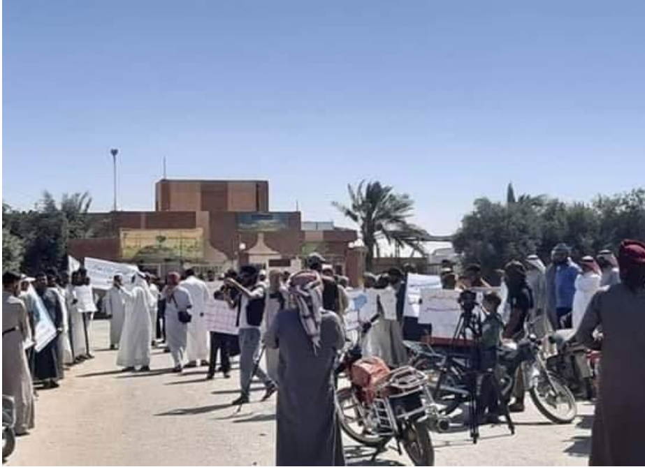
صورة من مظاهرة 24 حزيران/يونيو 2020 في قرية أبو حمام