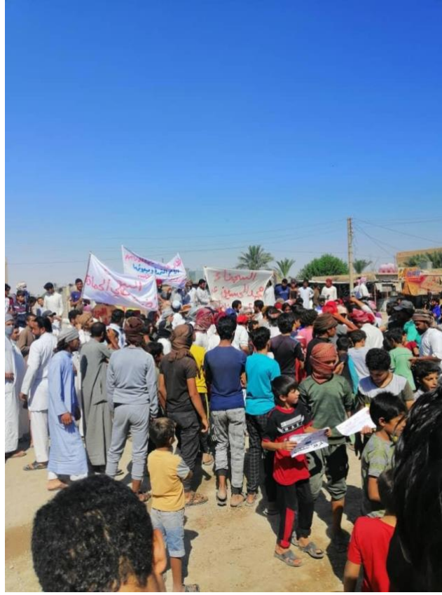
صورة مظاهرة 29 حزيران/يوليو 2020 في قرية غرانيج